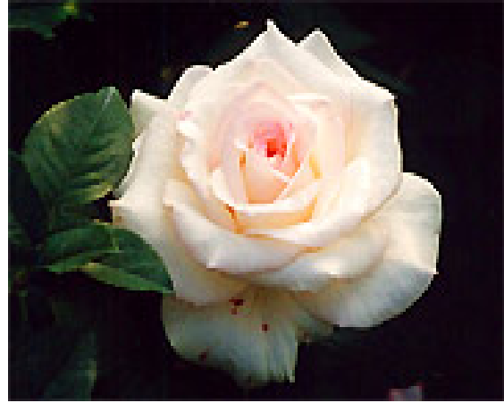
図2 ばら (初恋)